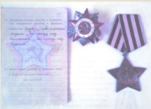
На фото: орден Отечественной войны и орден Славы III степени