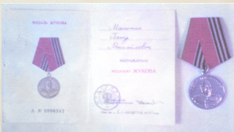
На фото: медаль Жукова