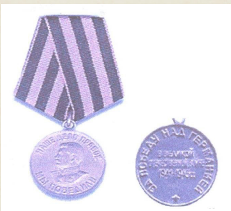
На фото: медаль «За победу над Германией в Великой Отечественной войне 1941 – 1945 гг.»