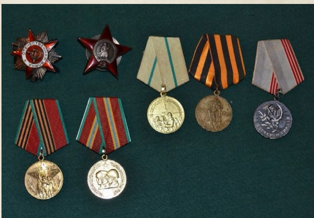
На фото: награды Петра Петровича Иванова