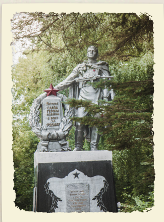
На фото: Скульптура на Братской могиле, Нижний Новгород

Еще при жизни деда и с его разрешения, скульптор, создающий памятник на братскую могилу, увековечил его лицо на фигуре солдата (кладбище Марьино Роцца, аллея воинской славы, Нижний Новгород).